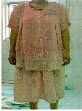
Áo váy phụ sản