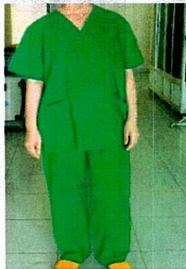
Quần áo mặc trong phẫu thuật viên